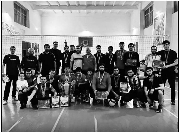
Волейбол развивает множество полезных физических качеств, помогает развить силу и выносливость, улучшает ко-

ординацию движений и баланс. Он также способствует развитию командных навыков. Команда волейболистов должна работать вместе, чтобы достичь общей цели - победы. Игра требует согласованной работы игроков, коммуникации и понимания стратегии. Волейбол развивает умение слушать других, адаптироваться к ситуации и принимать совместные решения в реальном времени. Умение эффективно сотрудничать с другими людьми может быть применено как в рабочей сфере, так и в личных отношениях. Помимо физических и командных навыков, волейбол развивает и психологические качества. Игроки должны быть сконцентрированы и сосредоточены на игре, чтобы отреагировать на мяч и выбрать правильную тактику. Уверенность в себе, решительность и умение контролировать эмоции - все это важные психологические аспекты игры в волейбол. Эти психологические навыки могут быть полезными в любых ситуациях, которые требуют быстрого принятия решений и управления стрессом.