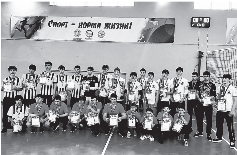
Волейбол - олимпийский вид спорта, популярный как среди мужчин, так и среди женщин. Регулярная игра в волейбол

оказывает закаляющее действие на организм, повышает выносливость организма. Укрепляет сердечно-сосудистую систему и улучшает кровообращение. Положительно влияет на дыхательную систему. Разнообразие движений и переменная интенсивность нагрузки при занятиях волейболом тренирует практически все группы мышц. Волейбол укрепляет опорно-двигательный аппарат, улучшает подвижность суставов. Тренирует мышцы глаз, расширяет поле зрения. Положительно влияет на нервную систему, улучшает настроение, помогает бороться со стрессами и депрессиями. Занятия волейболом развивают у детей и