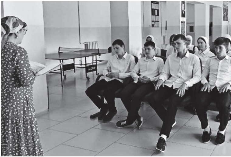
Ежегодно 3 сентября в России отмечается День солидарности в

борьбе с терроризмом. Эта памятная дата установлена в 2005 году федеральным законом «О днях воинской славы России» и связана с трагическими событиями в Беслане (Северная Осетия, 1-3 сентября 2004 года), когда боевики захватили одну из городских школ. В результате теракта в школе №1 погибли более трехсот человек, среди них 186 детей.